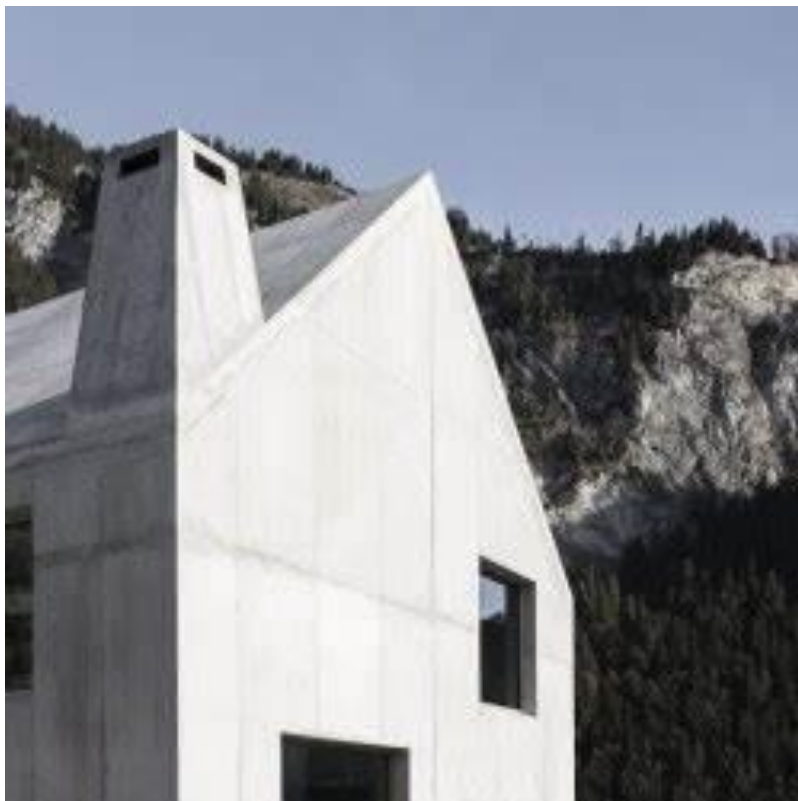
Architetture di Caminada

Guide: Accompagnatore di media Montagna e International Mountain Leader-UIMLA Nicola Dispoto; Architetto Rossella Mombelli.