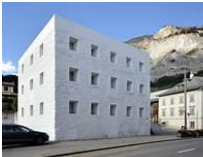
Gelbe Haus, Olgiati

L'osservazione e studio dell'architettura avverrà in parallelo ad una percezione slow del territorio tramite escursioni con ciaspole. A questo si aggiunge il desiderio di vivere da vicino l'esperienza dell'architetto, tramite incontri con gli studi oppure anche pernottando in un'opera. Per questo necessitiamo adesioni entro il 04 dicembre 2018 , per riuscire ad offrirvi un'esperienza unica nel suo genere.